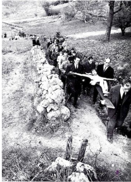
Figura 5. Recupero del crocifisso in seguito alla frana del 1966.

per agire e reagire, cerimonie proprie e propri rituali, processioni, ma anche luoghi e oggetti di forte valenza simbolica per la comunità, come il Campanaccio, il Pinnerone, il puntellamento di una chiesa, la cerimonia del recupero del crocifisso in Valfioriana.