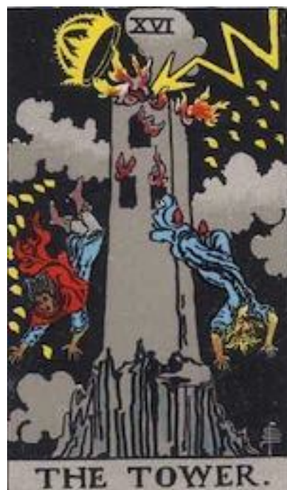
Figura 1. Tarocco 16, La Torre, di A. Rider Waite e P. Colman Smith, 1908-1909.