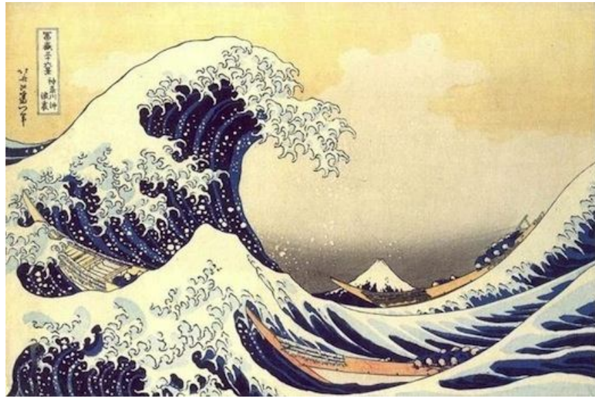
Figura 4. Sotto l'Onda di Kanagawa (La Grande Onda), xilografia dell'artista Katsushika Hokusai (1829 – 1833), serie delle Trentasei Vedute del Monte Fuji.